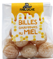
BILLES AU MIEL